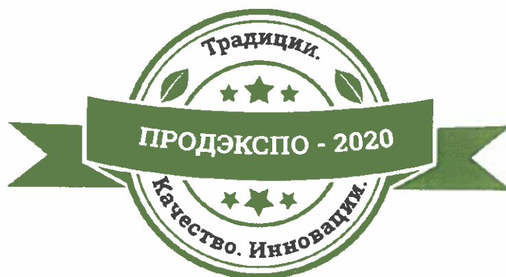
Рис. 1. Логотип