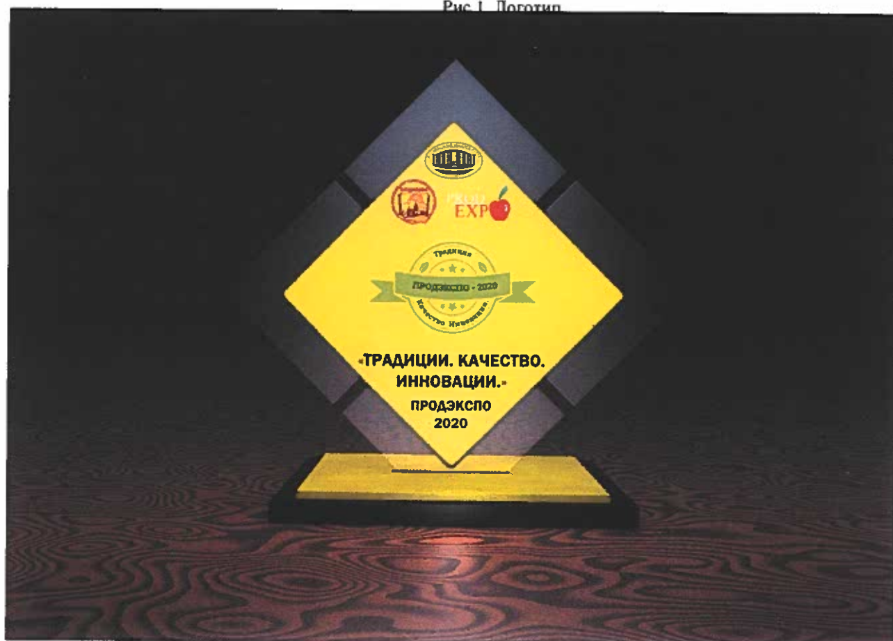
Рис. 2. – Гран-при Конкурса.