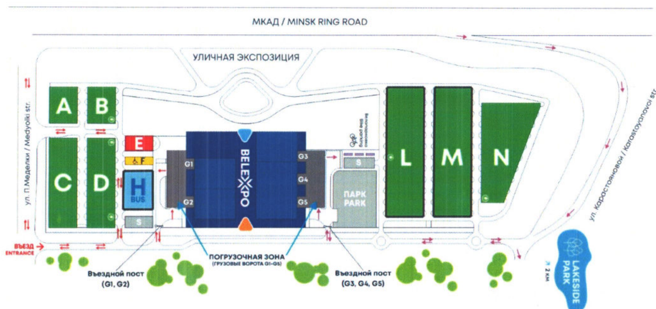
Рисунок 2 – План-схема размещения парковочных площадок и погрузочной зоны

КАТЕГОРИЧЕСКИ ЗАПРЕЩЕНО парковать транспортные средства на подъездных путях к зданию ММВЦ, создавать очереди из транспортных средств!